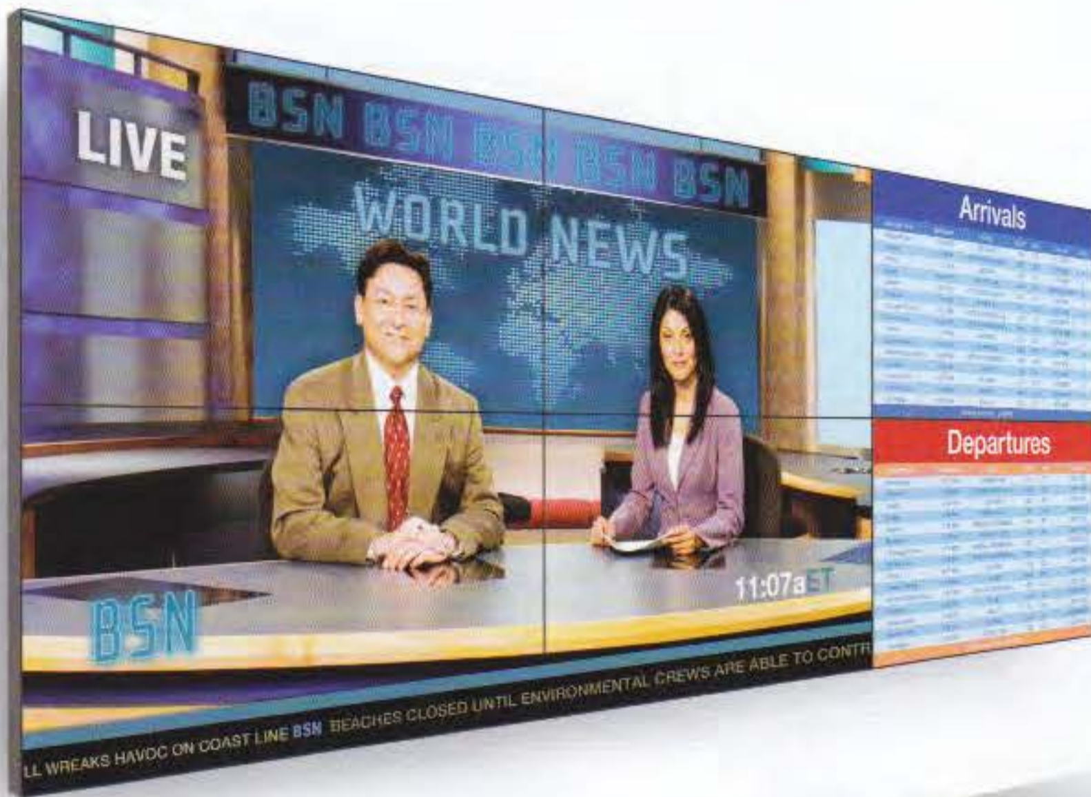
Auf „steglos“ LCD-Module setzt auch Planar mit seinen „Clarity“ Matrix-LCD-Videowandsystemen, die im Vertrieb von Trans Video Deutschland sind

den Einsatzkräften werden Multimedia-Anwendungen immer mehr an Bedeutung gewinnen. Maßnahmen zur optimierten Nutzung der Einsatzkräfte im Rahmen knapper Budgets werden in den Systemen berücksichtigt. Dies führt auch zur weiteren Konsolidierung und Kooperationen von Leitstellen.