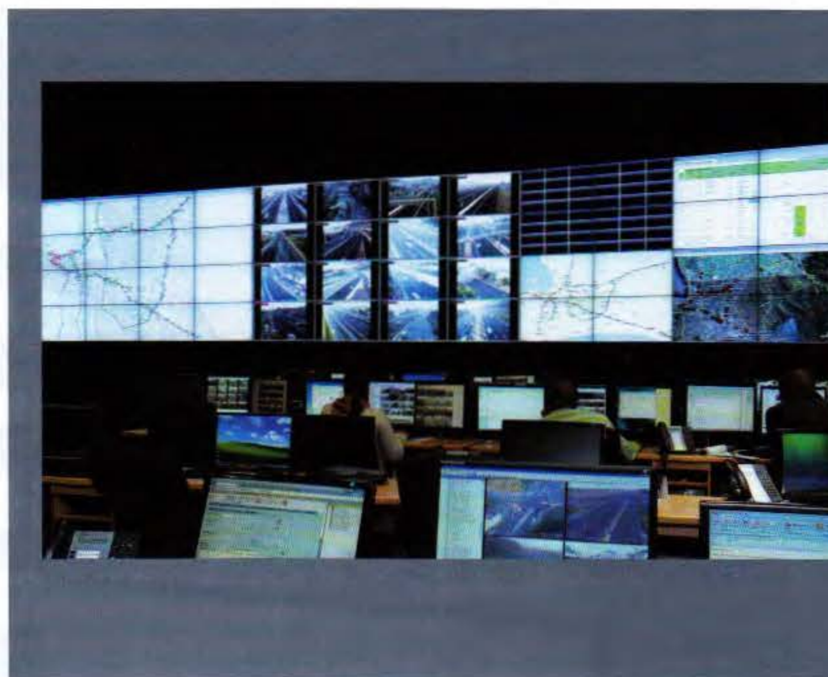
Die Bildwand – hier mit EYE-LCD-4600-SN-V2 LCD-Modulen umgesetzt – samt Ansteuerung in der integrierten Verkehrsleitstelle in Kapstadt-Goodwood, Südafrika, stammt von eyevis

Neben der eigentlichen Funktionalität wird bei den Managementsystemen verstärkt auf Flexibilität und Übersichtlichkeit Wert gelegt. So werden anstelle von vielen Einzelplatzmonitoren immer mehr Großbildsysteme gefordert. Grafische Bedienoberflächen mit flexibler Anordnung der Videobilder und gleichzeitiger Kontrolle mehrerer Gewerke (Videoüberwachung, Brandschutz, Zutrittskontrolle, usw.) sol-