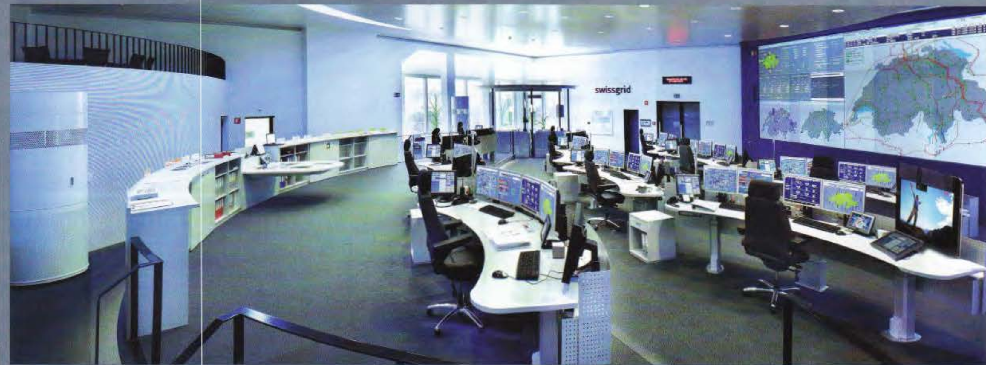
Die Einrichtung und Visualisierung (über Rückprojektions-Cubes) in der Leitstelle „Swissgrid Control“ wurde von Ergoconcept konzipiert

und Haustechnik erstellt und in detaillierten Einrichtungsvorschlägen mit photorealistischen 3D-Planungen und Animationen zusammengefasst. Die unterschiedlichen Systeme der diversen Hersteller stellen hohe Anforderungen an die Nutzer und an die Ergonomie der Arbeitsumgebungen. Der Mensch/Maschinen-Schnittstelle als kritisches Bindeglied zwischen der komplexen Systemtechnik und der operativen Nutzung wird von Ergoconcept besonderes Gewicht beigemessen. Die intuitiven Mechanismen bei der Bedienung der Kontrollräume werden projektspezifisch analysiert und in systemintegrierten Usability-Konzepten zusammengefasst. Das harmonische Zusammenspiel der ergonomisch optimierten System-Arbeitsplätze mit den angepassten Visualisierungen auf Großbildanzeigen ermöglicht eine hohe Bediensicherheit und gewährt auch während hektischer Großereignisse höchste Verfügbarkeit aller Ressourcen. Ergoconcept schafft als unabhängiges Ingenieurbüro innovative Arbeitsumgebungen, die die Arbeitsprozesse optimal unterstützen und sich an den Grundbedürfnissen der Mitarbeiterinnen und Mitarbeiter orientieren.