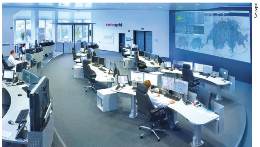
Blick in die Leitstelle: Drei Arbeitsplätze sind rund um die Uhr besetzt.

Jede Bilanzgruppe schätzt auf die Viertelstunde genau, wie viel Strom sie erzeugt und verbraucht. Diese Daten treffen spätestens einen Tag vorher in Laufenburg ein, und der Koordinator kontrolliert, ob das Netz so betrieben werden kann. Sollte dies nicht der Fall sein, trifft er Massnahmen. Dies kann bedeuten, dass zu dieser Zeit eine Lei-